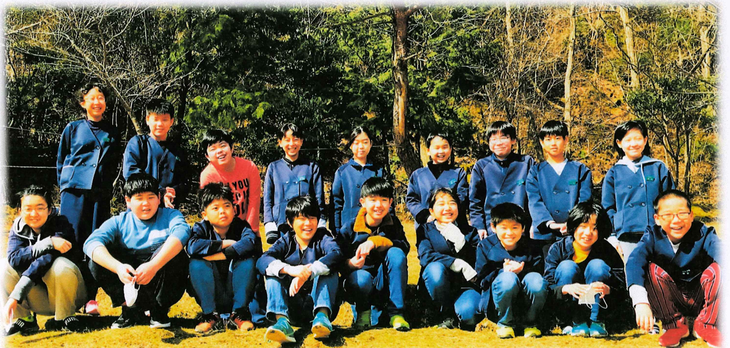
笑顔の6年生。 「自分は幸せだ」と いつも思える「あなた」でいてください。